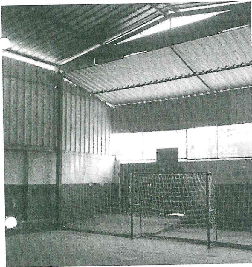
Reforma geral da quadra