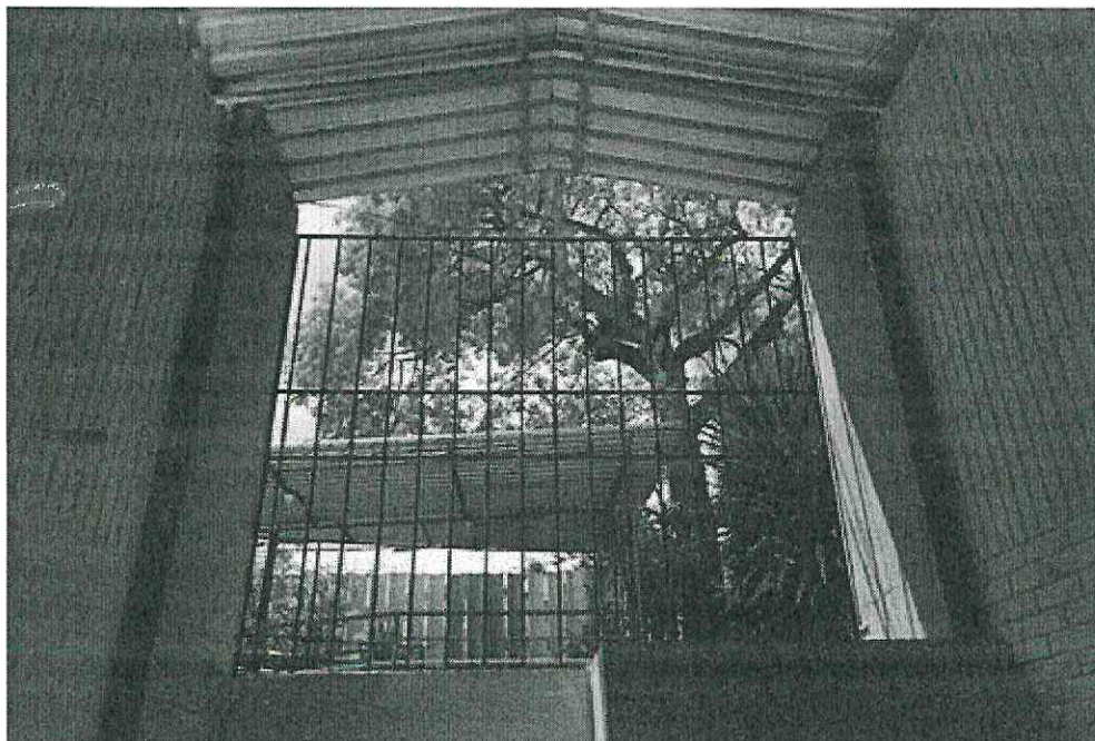
a ser fechada