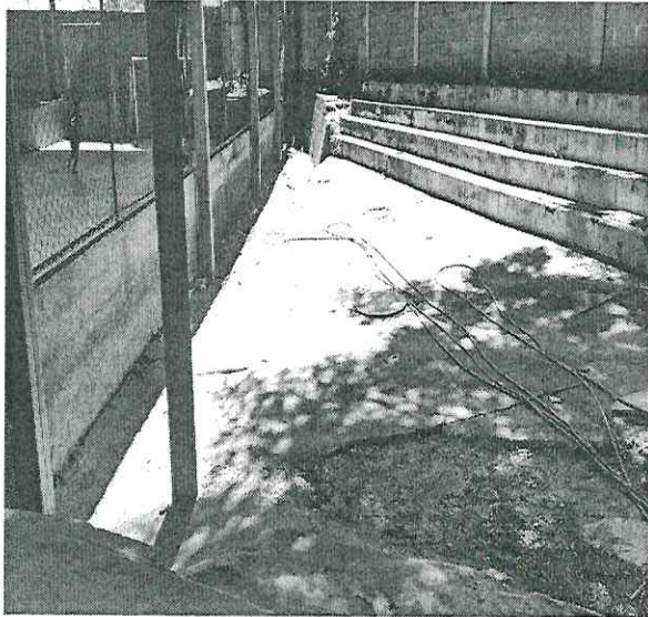
1. Vista da área da fossa.