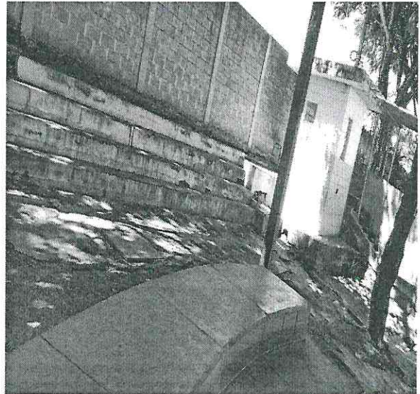
2. Vista da área da fossa – próxima a guarita.