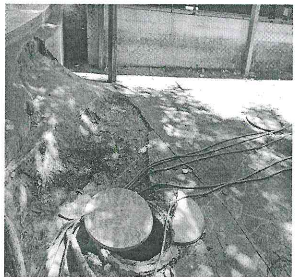
3. Vista da tampa da fossa.