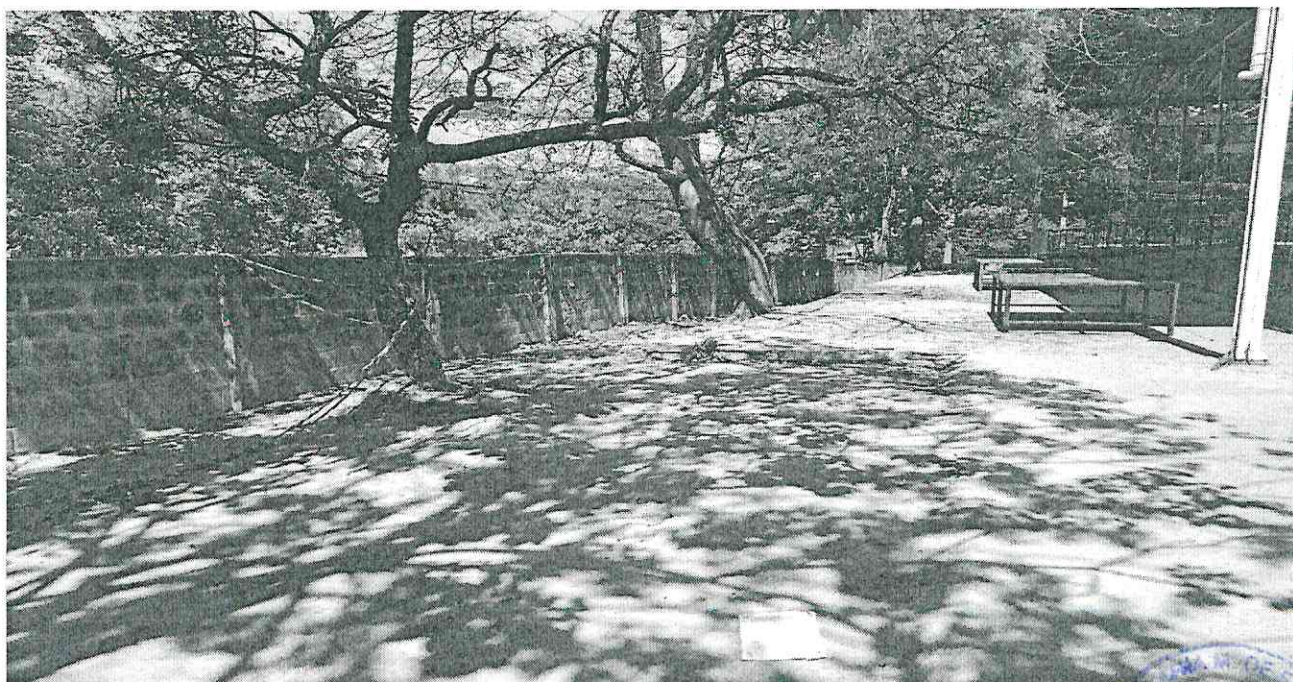
3. Demonstração da altura baixa do muro.