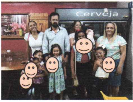
Tarde Especial de Açaí, com as crianças, no dia 12 de janeiro: