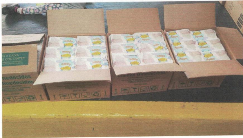
Fotos dos materiais de higiene pessoal