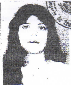
Porte gar Direito.