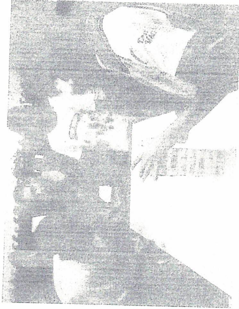
Teclando o Futuro – Jogos e descobertas (jenga) 14/05/2019