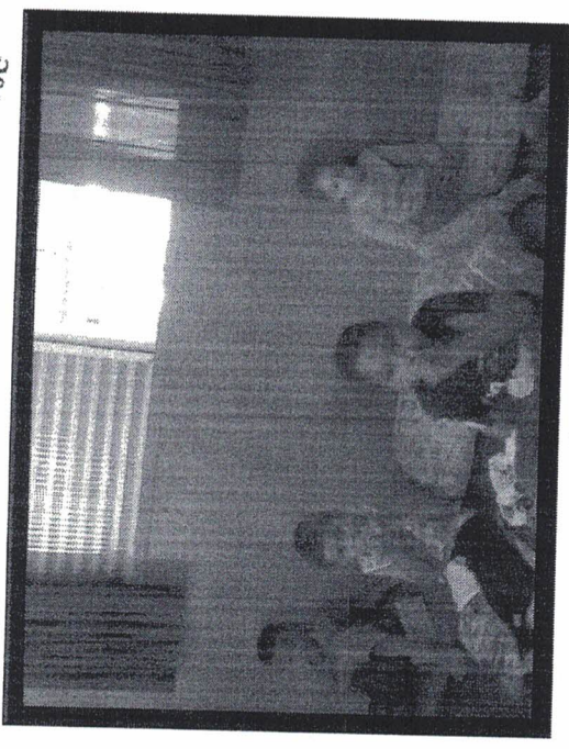
Doce leitura 22/05/2019