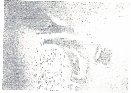
Teclando o Futuro – Jogos de raciocínio Lógico (quebra-cabeça 3D) 23/05/2019