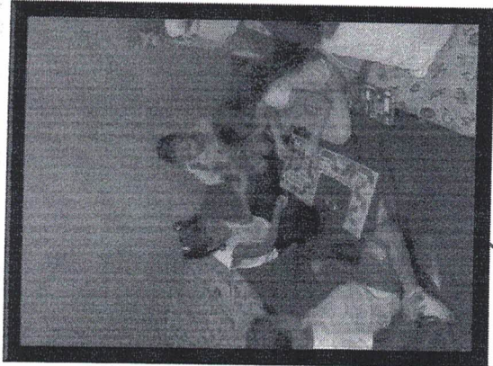
Sábã – Leitura do barulho 15/05/2019