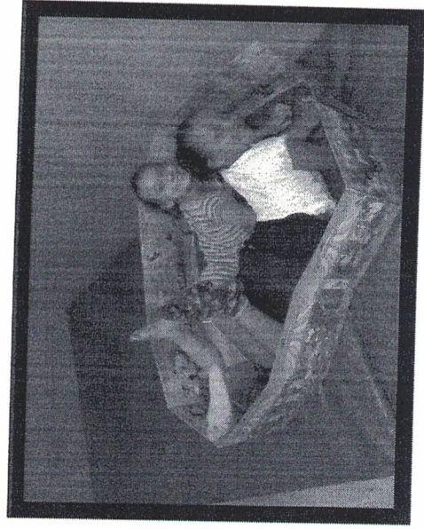
Sabiã – Leitura e letramento 10/05/2019