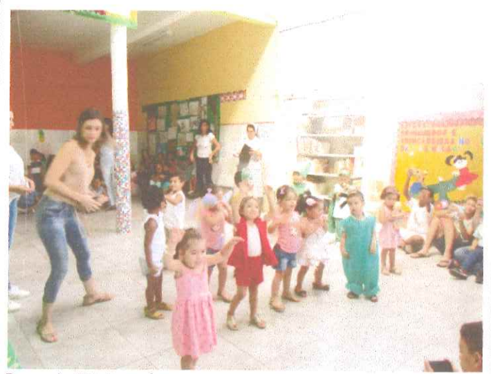
Berçario II Integral