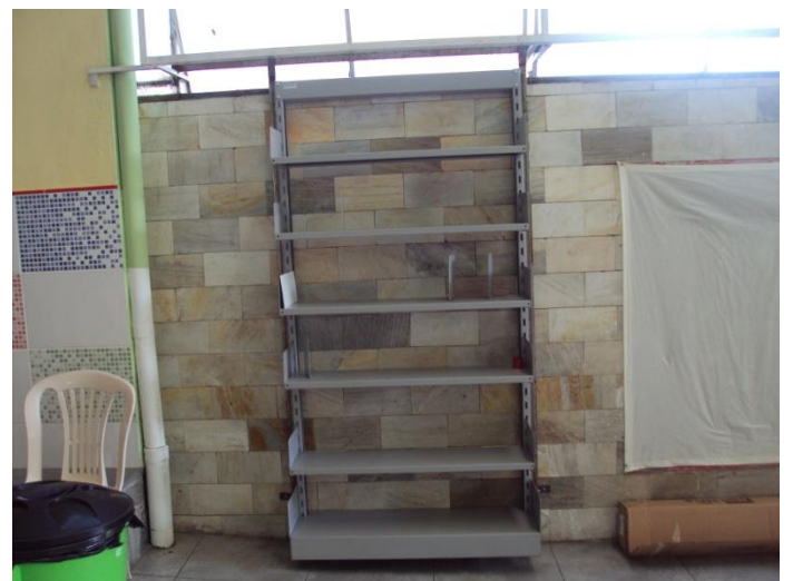
Pronta para uso