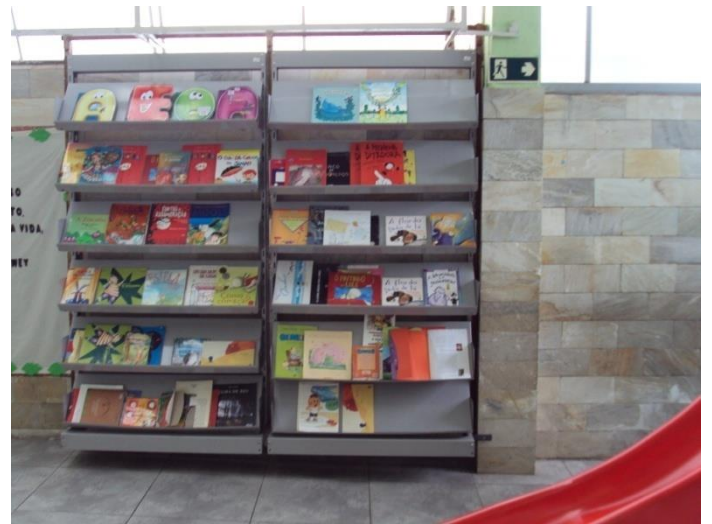
Com exposição dos livros para acesso das crianças