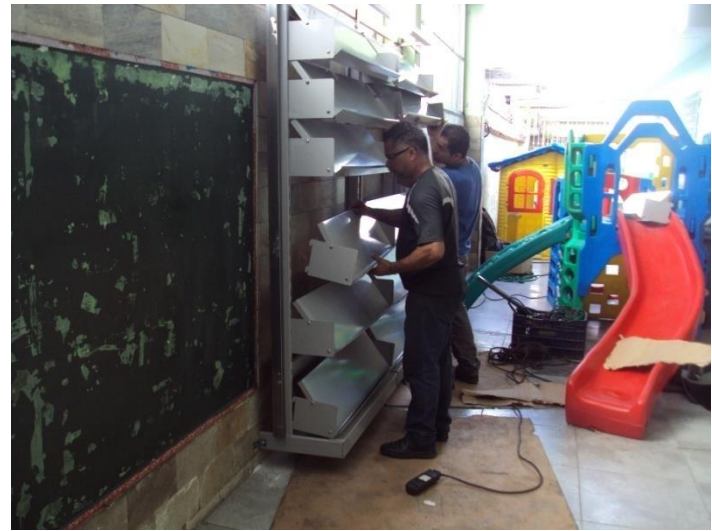
Instalando a ferragem