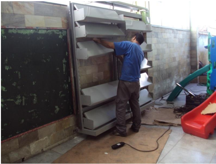
Instalando a ferragem