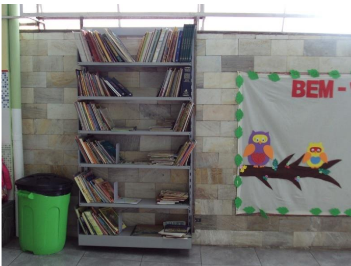
Com exposição dos livros para acesso das crianças