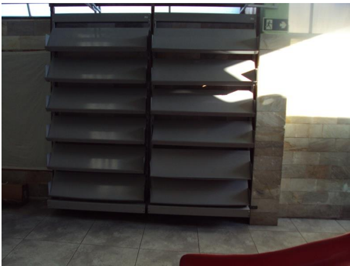
Pronta para uso