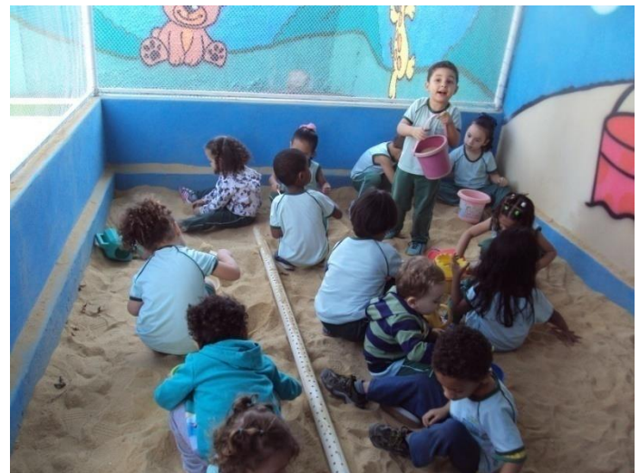
Tanque de areia 07/07/2018