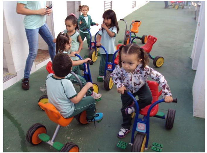
Espaço para andar de bicicleta 07/07/2018