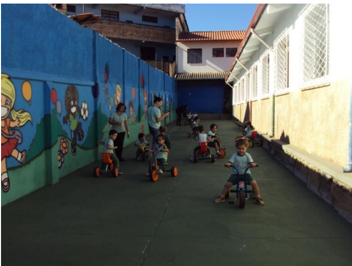
Espaço para andar de bicicleta 07/07/2018