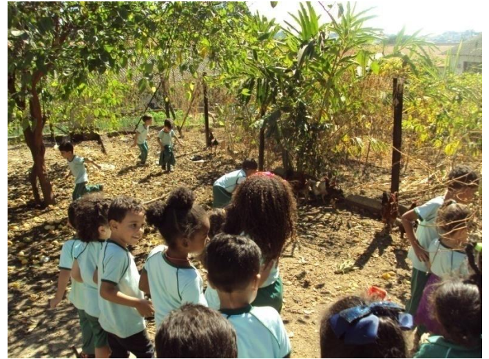
Galinheiro e horta 07/07/2018