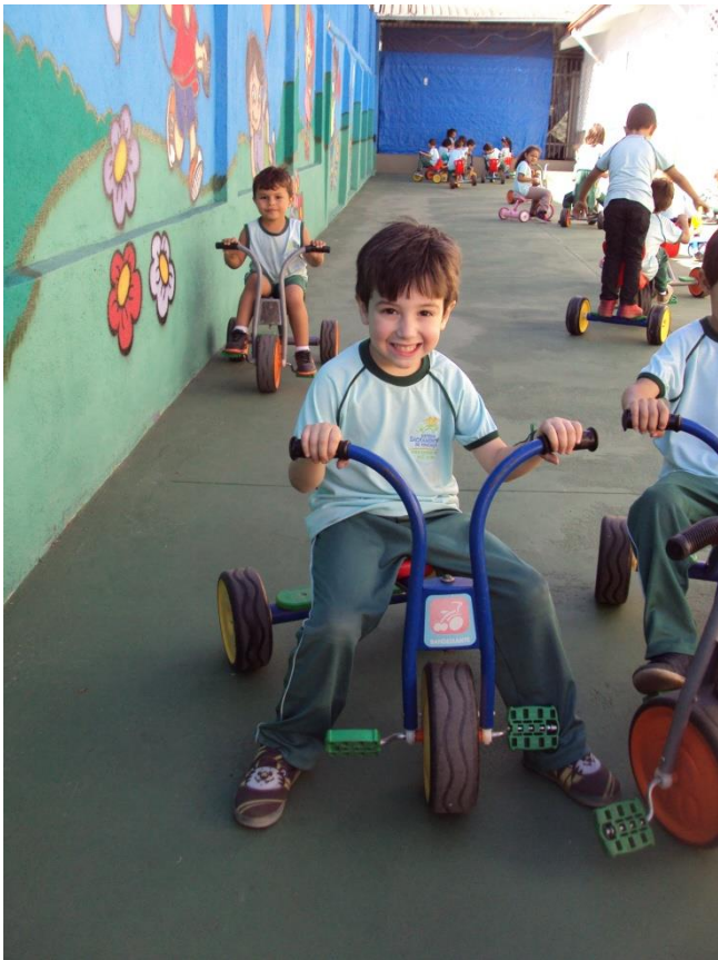
Espaço para andar de bicicleta 07/07/2018