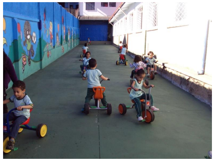
Espaço para andar de bicicleta 07/07/2018