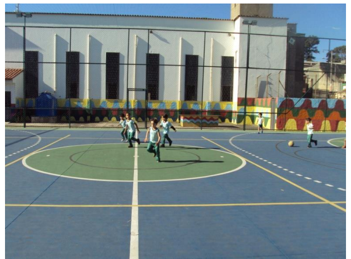
Quadra de esporte 07/07/2018