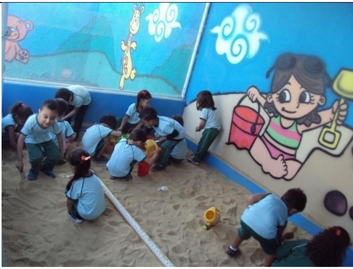
Tanque de areia 07/07/2018