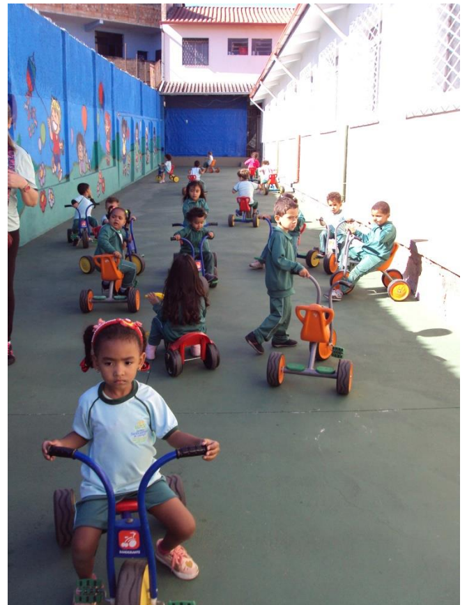
Espaço para andar de bicicleta 07/07/2018