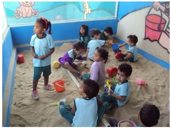
Tanque de areia 07/07/2018