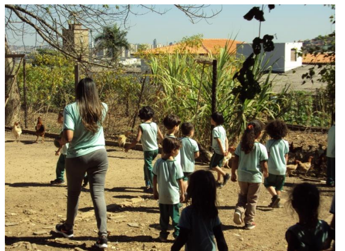
Galinheiro e horta 07/07/2018