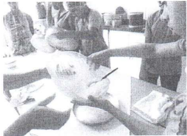
Oficina de Culinaria