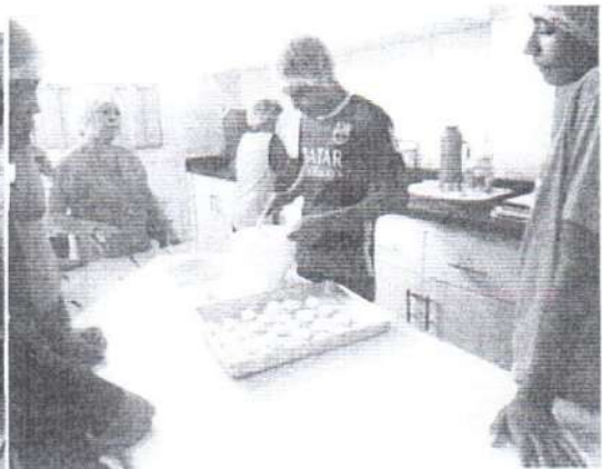
Prática da Oficina de Culinaria