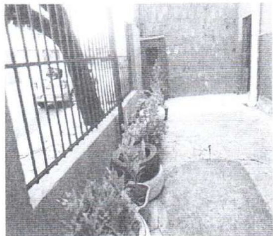
Entrada da casa com Plantas em Pneus