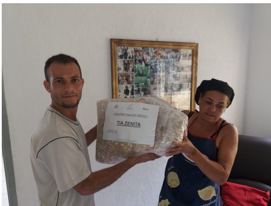
CENTRO DIA DO IDOSO TIOA ZENITA