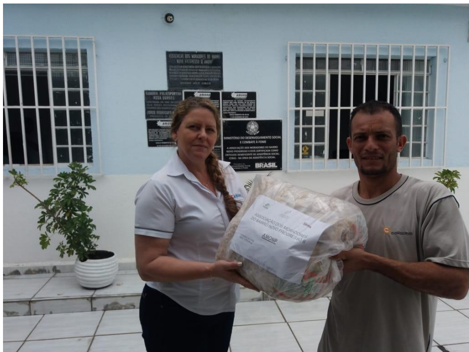
ASSOCIAÇÃO DOS MORADORES DO BAIRRO NOVO PROGRESSO