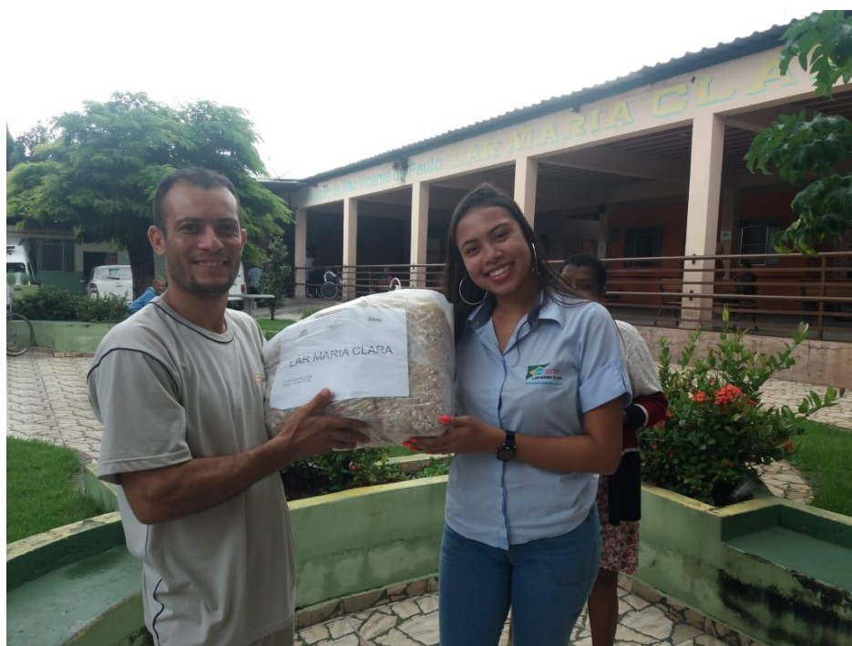
LAR MARIA CLARA