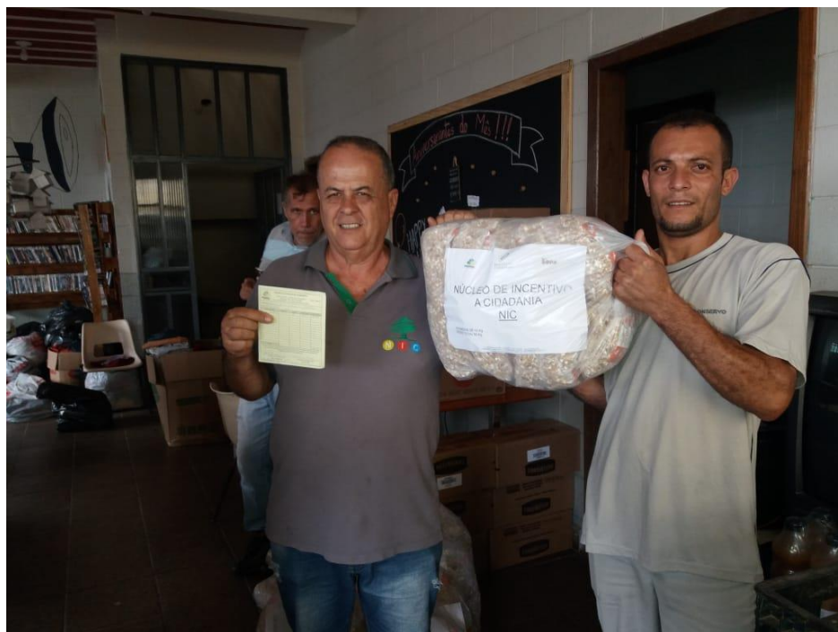
NÚCLEO DE INCENTIVO A CIDADANIA