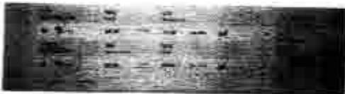
IMG-20190320-WA0013.jpg 43 KB

Marcella Balthazar de Uello Peixoto Tavares CPF - 049.215.634-46 Data. Naxe. 16/08/1985