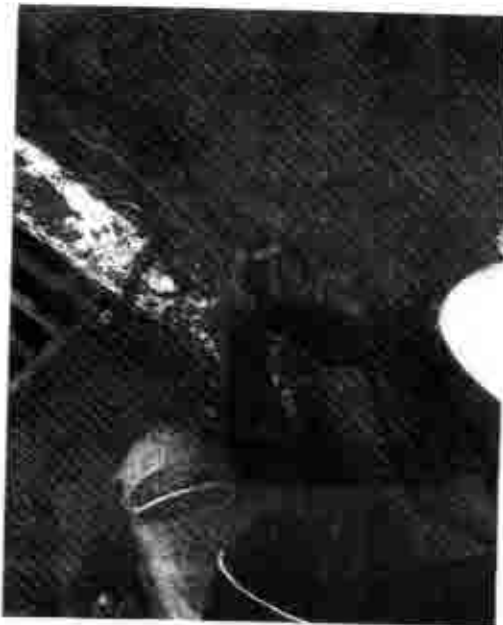
Avenida Canta Galo (Novo Riacho) 26/01/2019