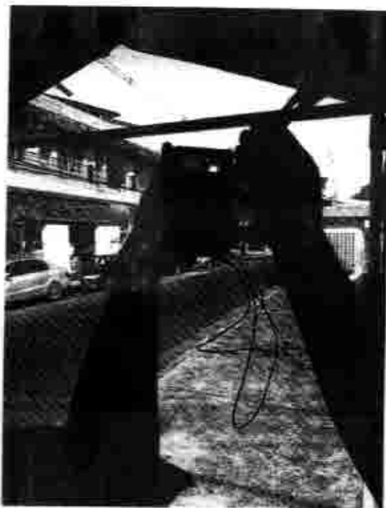
Praça Nossa Senhora da Conceição (Novo Eldorado) 26/01/2019