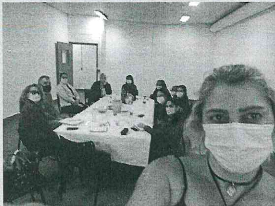
Reunião de equipe