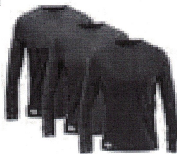
Kit com 3 Camisetas Camis