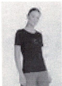
Blusa Com Bordado Feminina Regule