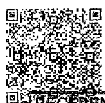
Tabela Total a Pagar (Lei Federal 12.741/2012)

Protocolo de autorização: 1312009/9194732 Data de autorização: 02/04/20 15:26