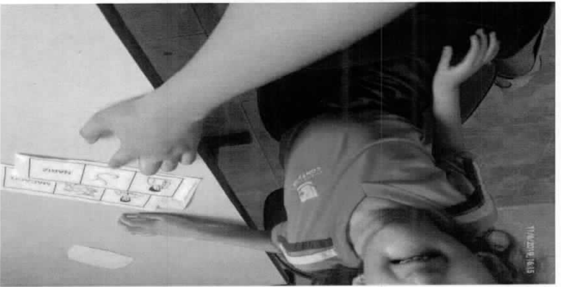
OFFICINA DA FALA – NOVEMBRO 2019