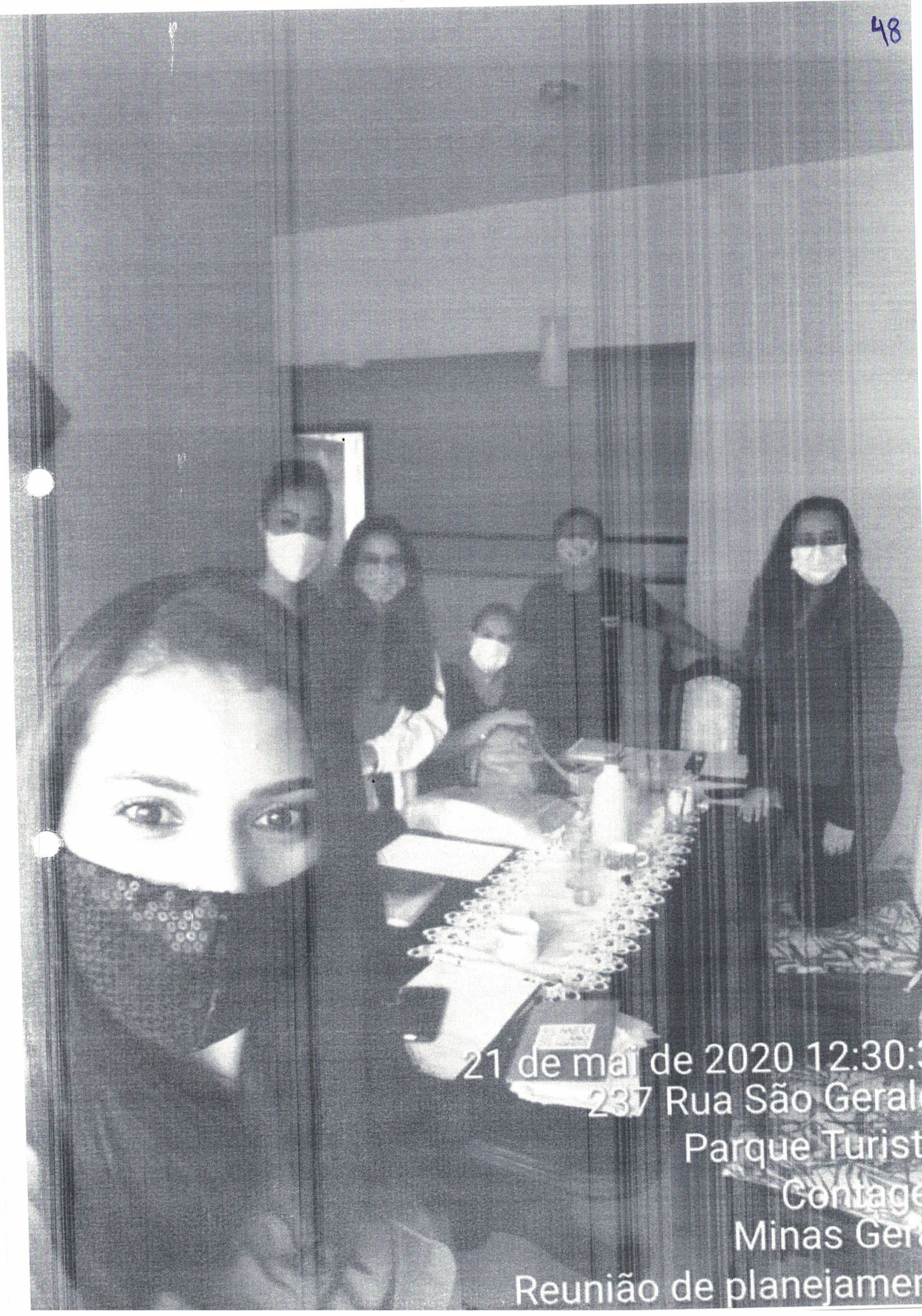
21 de mai de 2020 12:30: 237 Rua São Geral Parque Turist Contage Minas Ger Reunião de planejamer