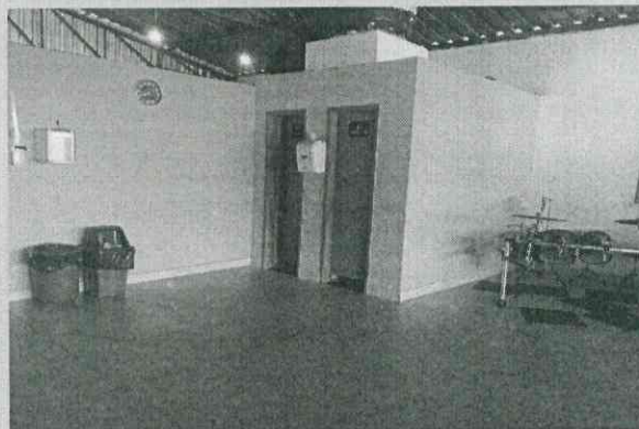
Banheiros e água