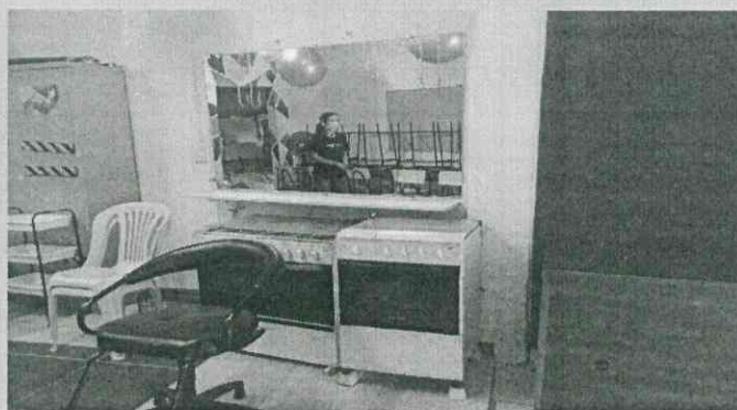
Curso cabeleireiro Barroquinha