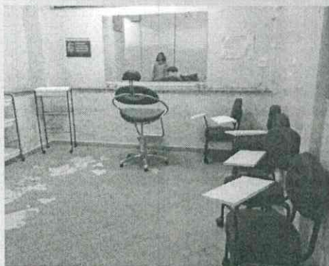
Visão geral da sala cabeleireiro no subsolo