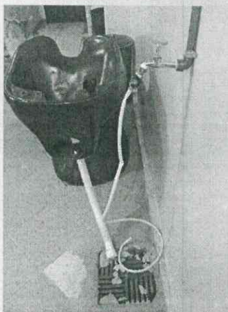
Lavatório sem rede esgoto adequada visita