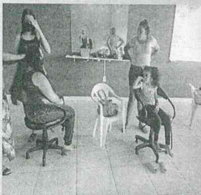
Aulas de cabeleireiro