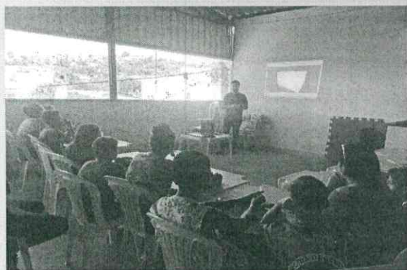
Sala de aula