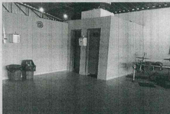
Banheiros e água