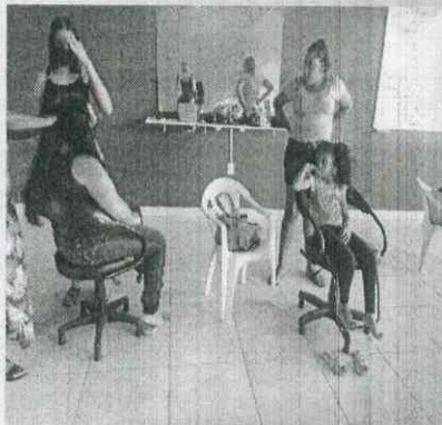
Aulas de cabeleireiro