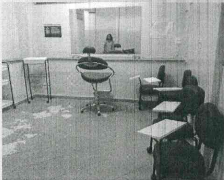
Visão geral da sala cabeleireiro no subsolo