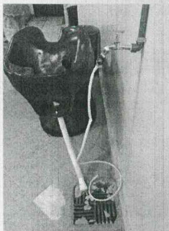
Lavatório sem rede esgoto adequada visita