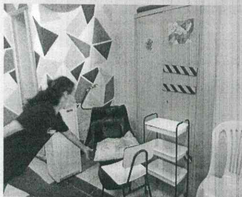
Curso cabeleireiro Barroquinha