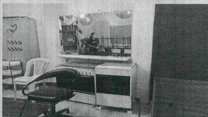
Curso cabeleireiro Barroquinha