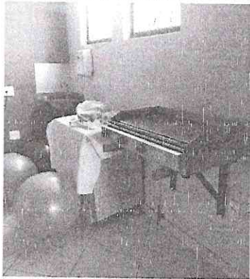
Chapa, fogão, pia e paredes sem revestimento