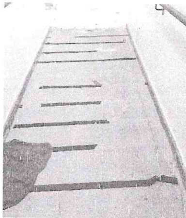
Rampa de acesso à sala de aula de cabelereiro